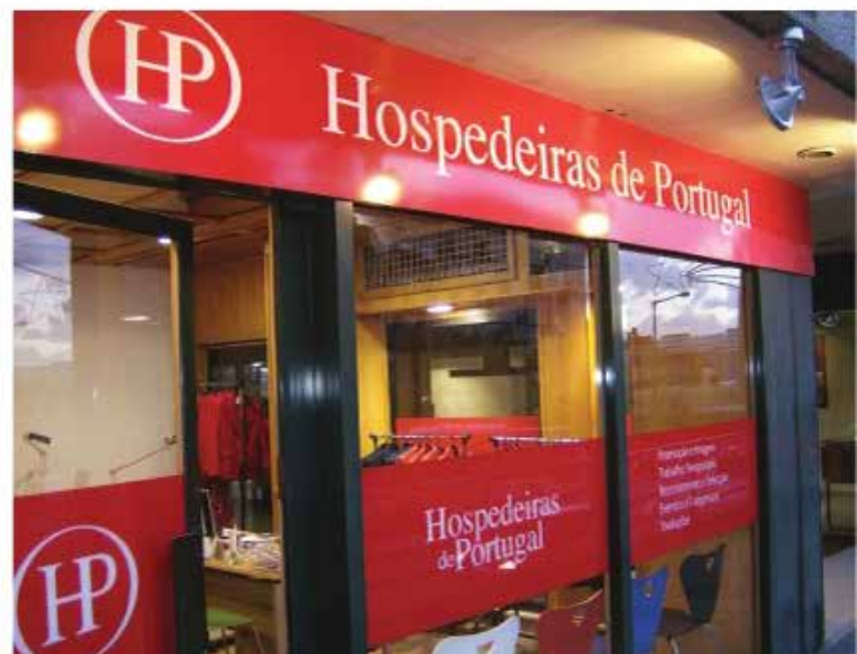
Escritório das Hospedeiras no Porto, na Avenida da Boavista