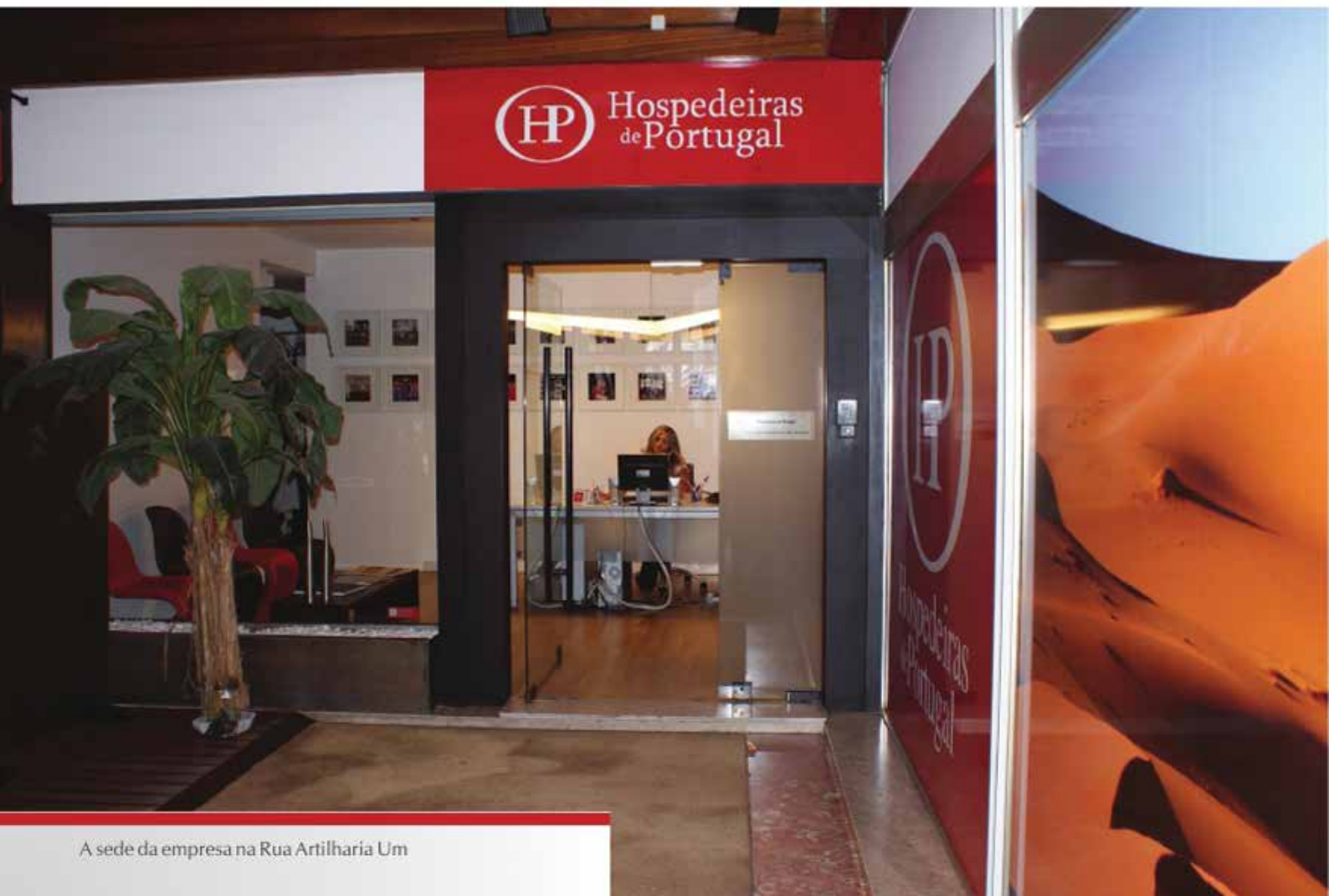
A sede da empresa na Rua Artilharia Um