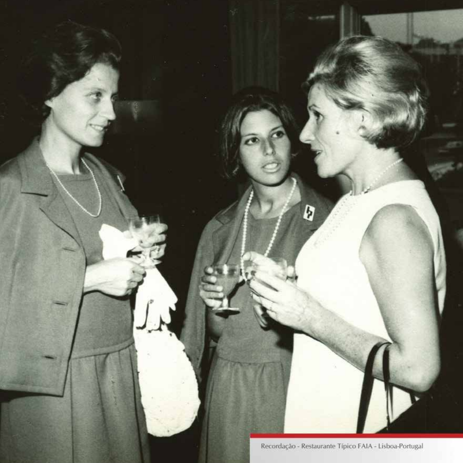
Recordação - Restaurante Típico FAIA - Lisboa-Portugal