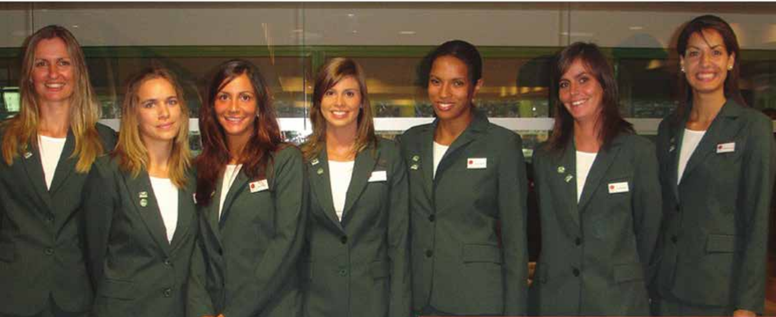
As equipas da HP que estão presentes nos estádios do Benfica e do Sporting.