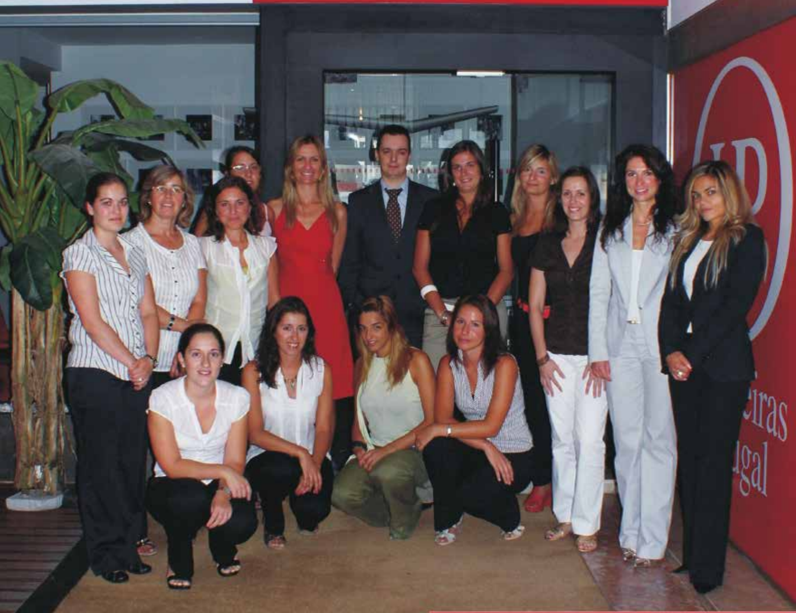
A equipa interna do escritório de Lisboa, responsável pela alocação das Hospedeiras de Portugal aos diversos trabalhos