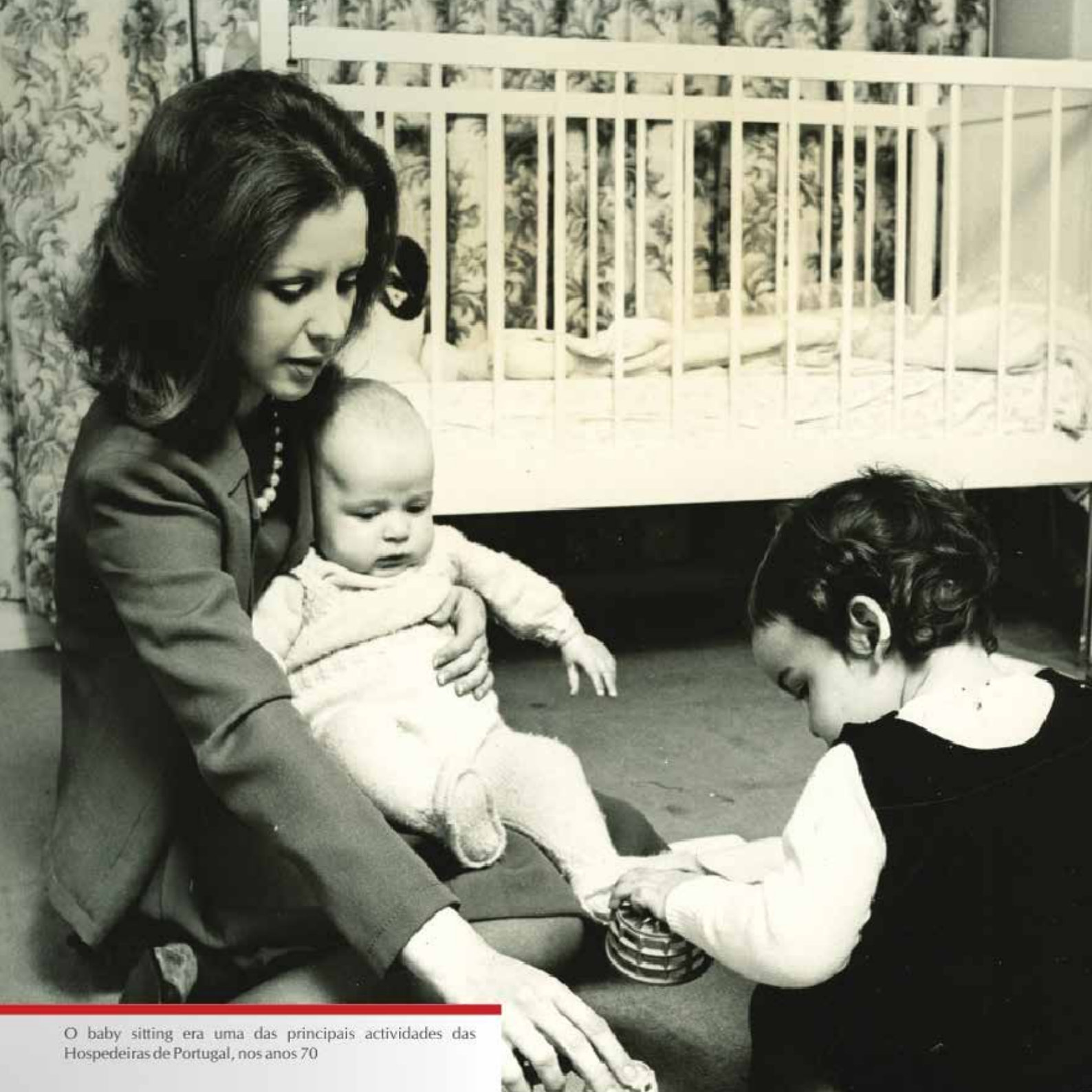
O baby sitting era uma das principais actividades das Hospedeiras de Portugal, nos anos 70